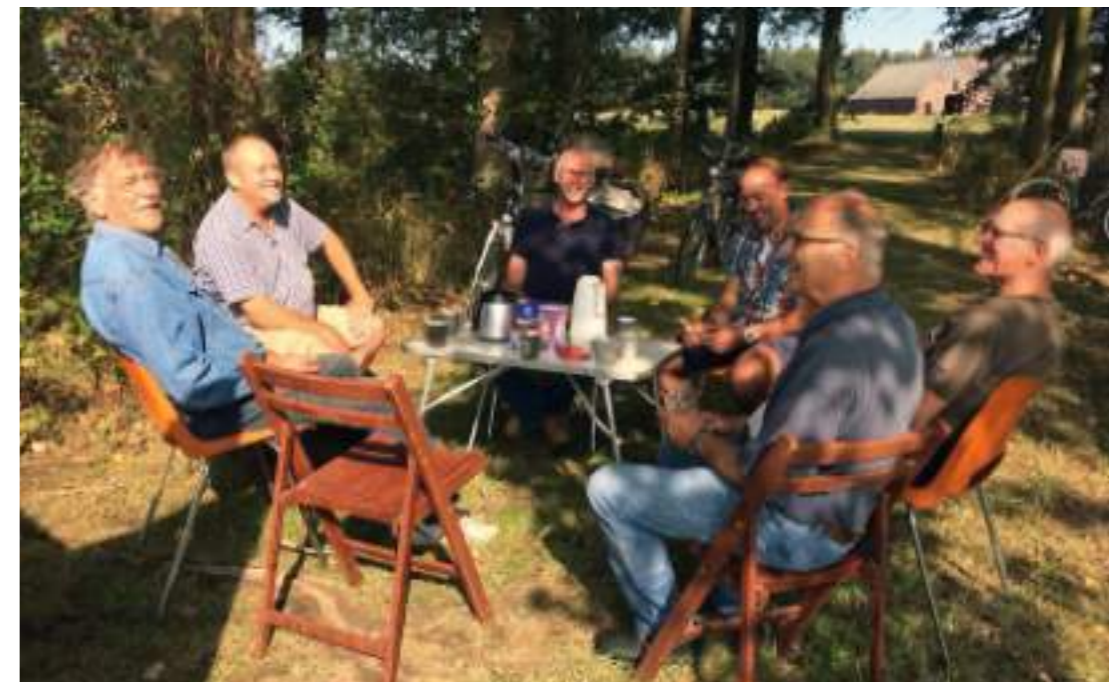
..... Ook aan het Welsinkpad is er op tijd een gezellige pauze met koffie en thee. ....

De eiken aan het Welsinkpad waren al jaren toe aan een opknapbeurt vanwege veel dode takken aan de stammen. Ook om aansprakelijkheid voor schade door vallend hout te voorkomen was het nodig om de dode takken te verwijderen. Om dit hoog genoeg uit te kunnen voeren