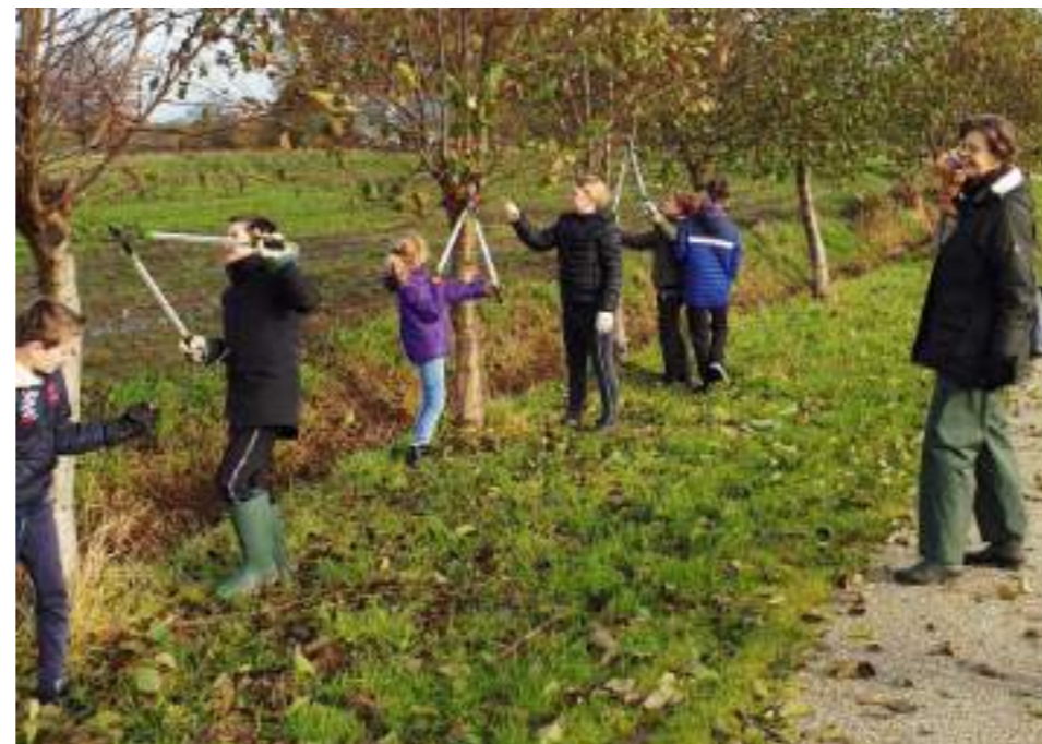
..... Leren door doen - en in de buitenlucht .....