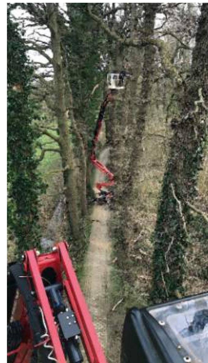
Zicht op het Welsinkpad vanuit vogelperspectief.