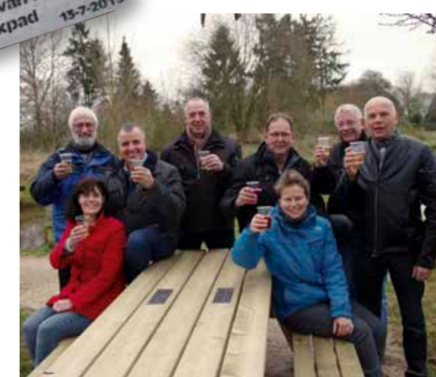
Feestelijke ingebruikneming van de nieuwe picknickbank door de loonwerkers van Wescom en ons bestuur