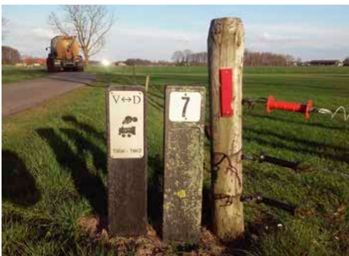
Päältjen aan de Wissinklaan