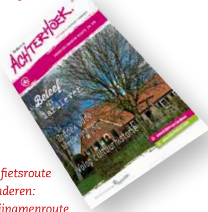
De nieuwe fietsroute rondom Sinderen: de Boerderijnamenroute