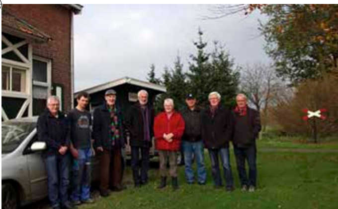
De uitvoerders van het Päältjesplan