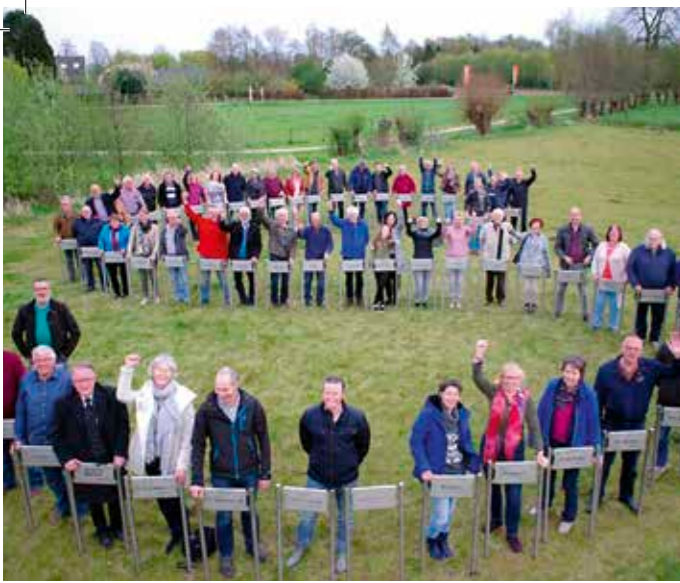
Deelnemers aan het Boerderijnamenproject met hun zojuist ontvangen bord