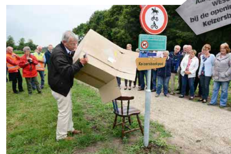
Een verrassend cadeau, aangeboden door de loonwerkers Essing, Wildenbeest en Westerveld