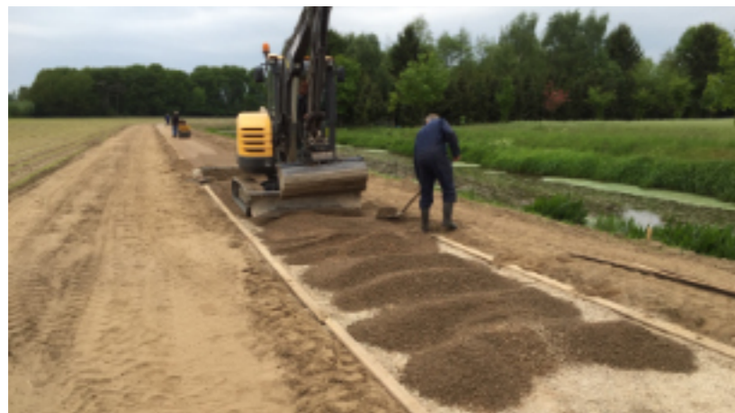
boven: Aanleg Keizersbeekpad in Sinderen onder: Bestuursleden tijdens de jaarlijkse regiobijeenkomst

Het is de toenmalige Heer van Borculo geweest, die zijn invloed liet gelden naar zuidelijker Achterhoekse streken, om katholiek te blijven. De - in zijn tijd invloedrijke - stad Groenlo heeft deze lijn met verve gevolgd. Zo is een omvangrijke katholieke enclave blijven bestaan in de streek van Borculo een beetje naar het oosten, van Eibergen via Zwillbrock naar Groenlo en Lichtenvoorde, ten westen van Aalten, en van Varsseveld globaal in een ruime boog weer naar Borculo. Een gebied dat slecht ontsloten is geweest, een beetje vergeten, en gekoeioneerd door de protestanten, later, toen deze de katholieken verboden om naar de mis te gaan in hun katholieke kerken. Men wandelde altijd te voet naar die grote kerken in Groenlo, Zieuwent, Borculo, Lichtenvoorde, Beltrum, Mariënveld en Harreveld. Alleen de barokke kerk, net over de grens in Zwillbrock, bood enige tijd nog uitkomst bood voor mis en avondmaal. Men onderhield een fijnmazig net van paden en voetwegen, die de voeten droog hielden te midden van omringende natte soppigheid. Geen landedelman wilde hier toen wonen. Een streek van heide en nattigheid, met vooral berken en elzen, en hier en daar eiken bij de boerenerven en langs sommige wegen.