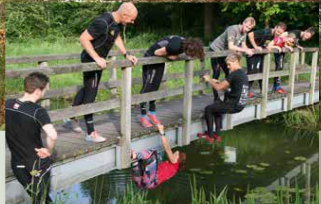
Survivalgroep Breedenbroek maakt goed gebruik van onze paden