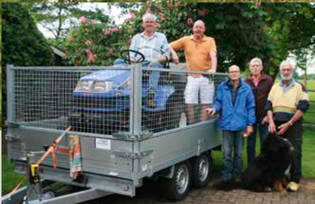
Nieuwe aanhangwagens met tevreden vrijwilligers